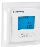
Comfortemp 760i www.varmecomfort.no

Følg for øvrig gulv- leverandørens anbefalinger verdørende innvarming av gulv.